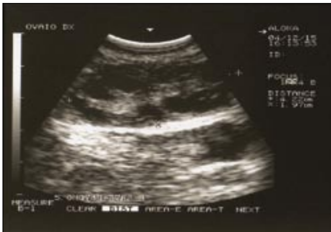
Figura 4. Il “Necklace sign”

sia realmente efficace rispetto al “no coasting” (23) o ad altri interventi (coasting vs criopreservazione) (24), coasting vs albumina i.v. (25) nel prevenire la sindrome, né vi sono certezze su quale sia con tale approccio l’intervallo migliore o massimo da rispettare senza avere esiti negativi sulla qualità ovocitaria sulla pregnancy rate (26).