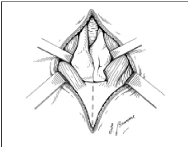
Figura 2. Visione chirurgica dei lobi timici una volta retratti i capi sternali dei muscoli sternocleidomastoidei. Da Mazzera et al. 6 , con il permesso dell'Editore.